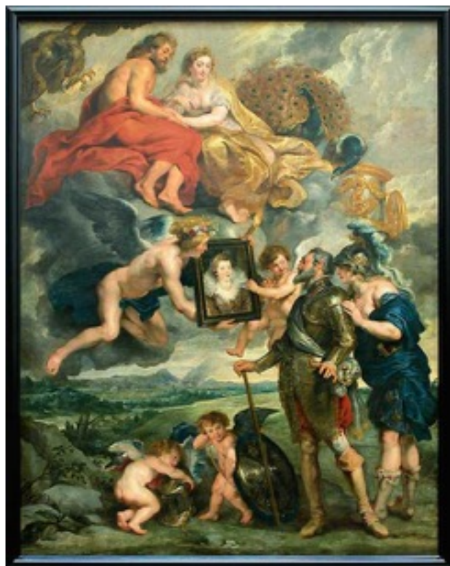
Présentation du portrait de Marie de Médicis au roi Henri IV de PP Rubens réalisé entre 1622 et 1625